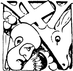
Sint Hubertus Het kerfje in moderne stijl (plaque) van Mendes da Costa in de muur der binnentuin van het landhuis op de Hoge Veluwe

De opening van de jacht op de Hoge Veluwe was dit jaar op dinsdag 5 november, omdat de eigenlijke datum, 3 november, op een zondag viel.