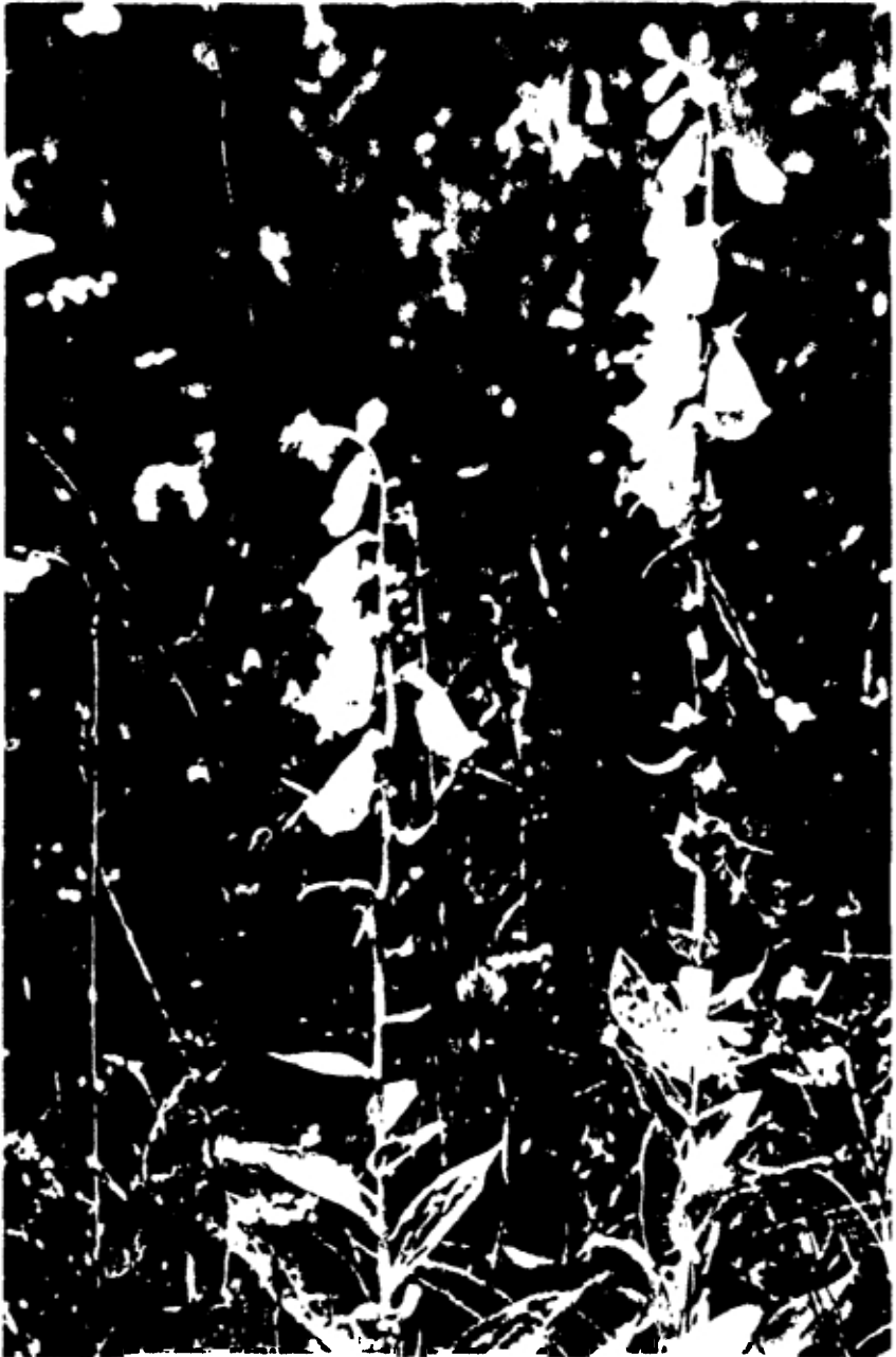
GROOTBLOEMIG VINGERHOEDSKRUID ( DIGITALIS GRANDIFLORA )