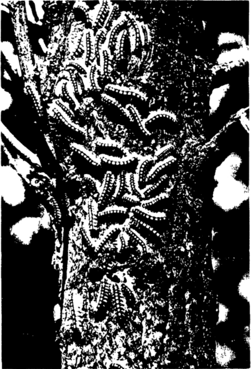
RUIPSEN VAN DE SATINVLINDER OP POPULIERESTAM