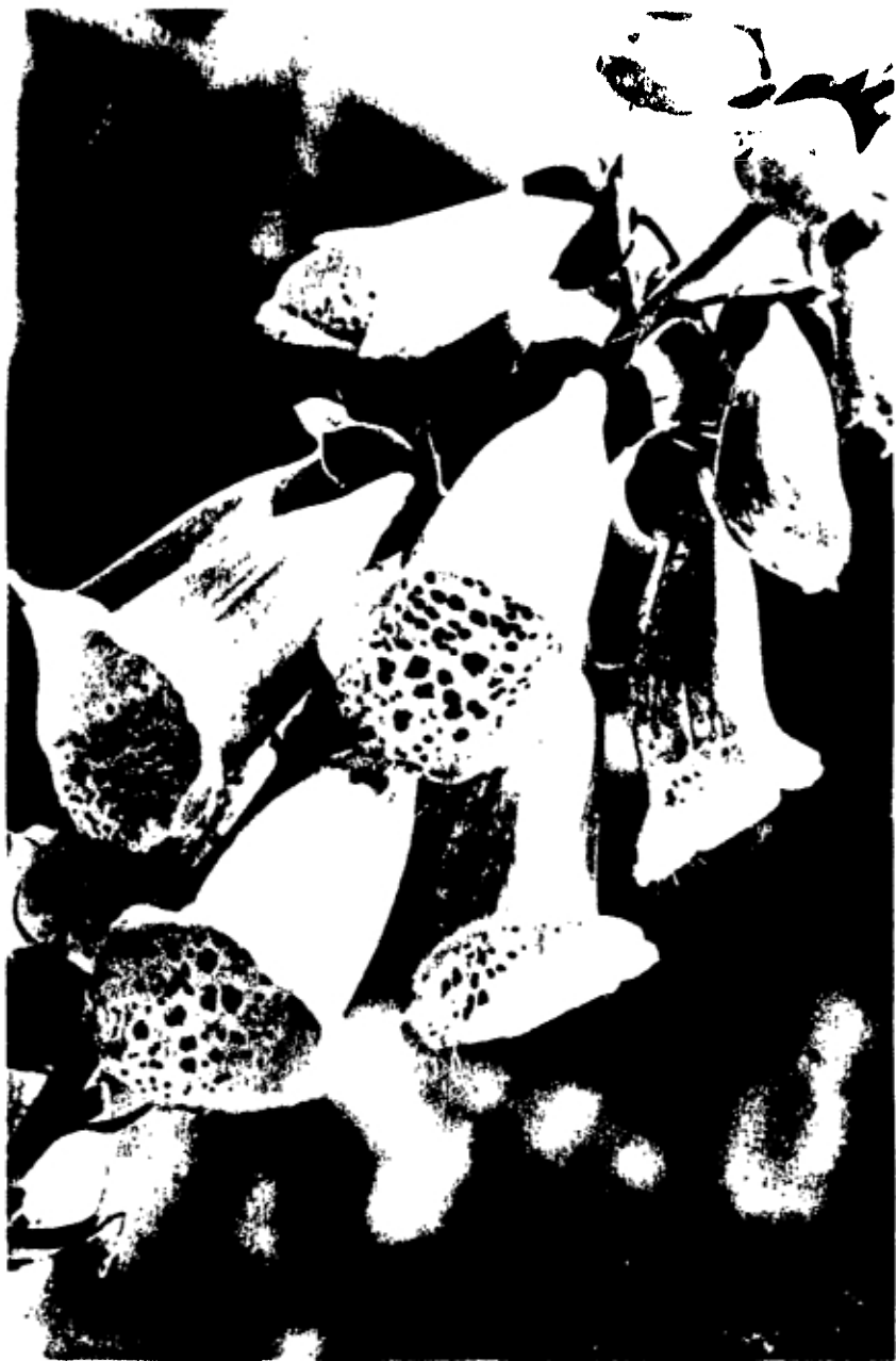
VINGERHOEDSKRUID ( DIGITALIS PURPUREA )