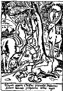
Oude kopergravure der ontmoeting van Hubertus met het miraculeuze hert.

Oorspronk aan: „Kunsts Begriff des Lebens und Wunderwerks des H. Hubert. Ardennen Patron“, gedruckt in Luttenburg A° 1722.