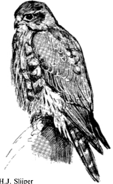
Tekening: H.J. Slijper