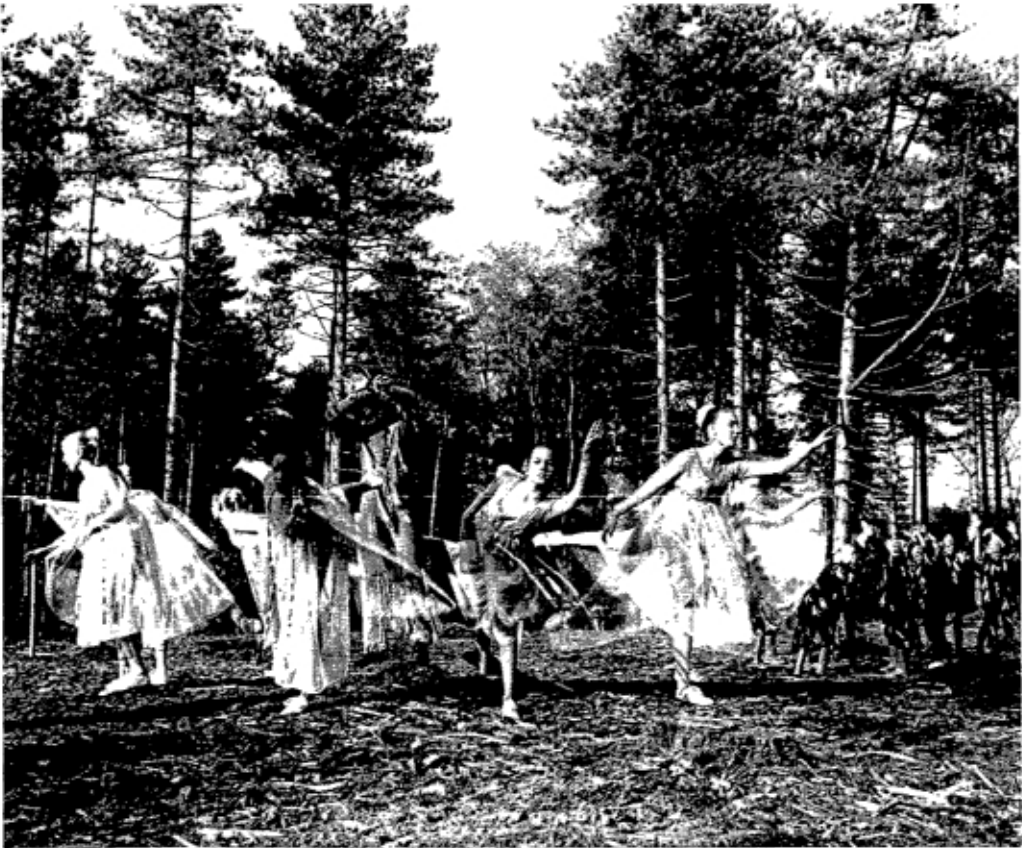
Dansende elfjes (hoort bij artikel Geboortebos)

middagprogramma: een bezoek aan enkele nieuwe projecten (drie van de vijf zijn intussen gereed) in het Museonder en aan de Landschappentuin. Bij de zogenaamde wildtocht over de Hoge Veluwe lieten alleen de moeflons ondanks het mooie weer of juist dank zij het mooie weer zich op grote afstand bij het Bosje van Staf zien. De Hoge Veluwe Persdag werd besloten met een gezellig samenzijn in restaurant Rijzenburg.