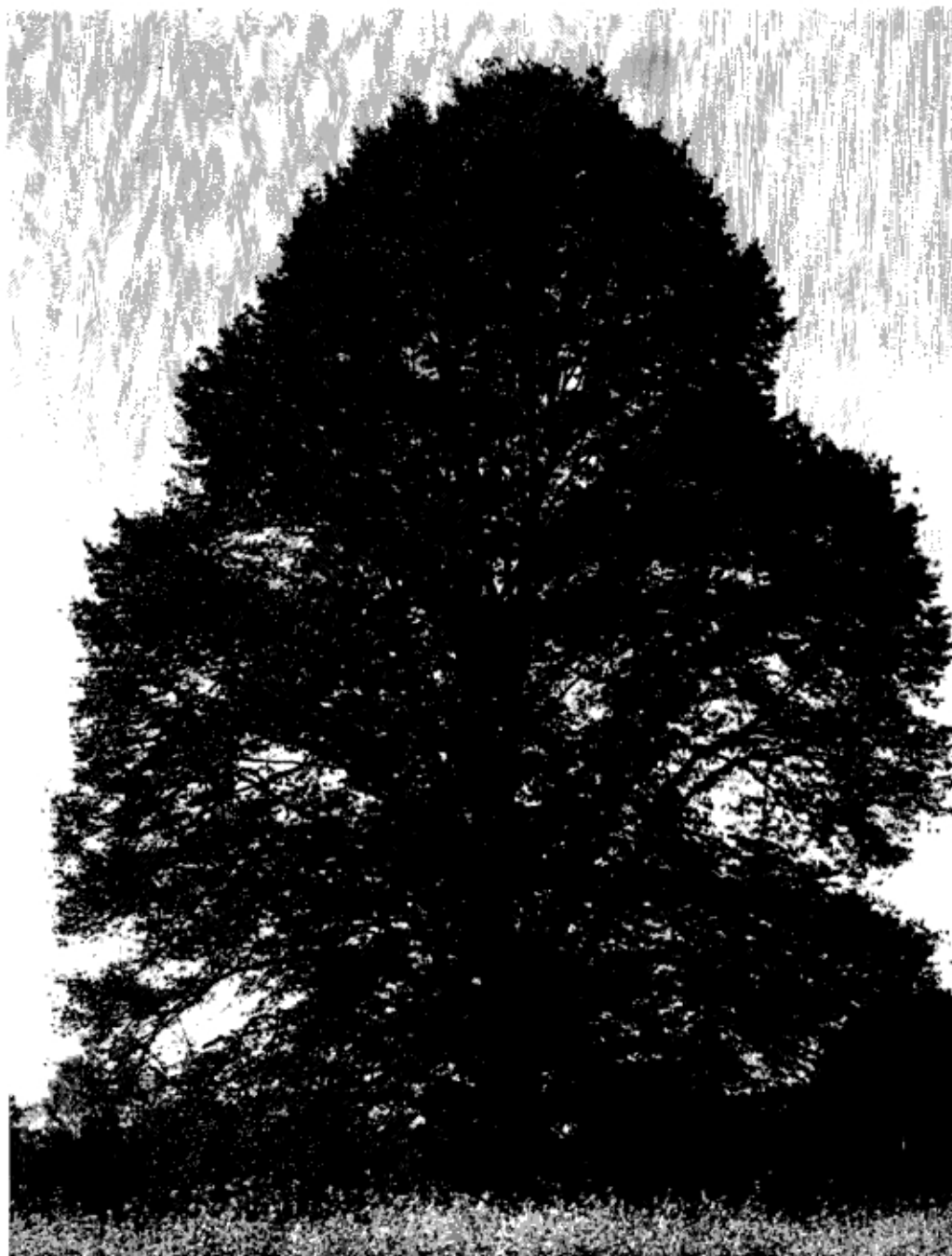
Oude linde op "de Bunt" met boekweitakker op de voorgrond.