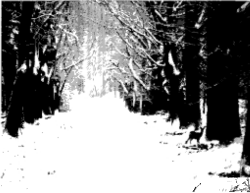
voedselzoekend ree